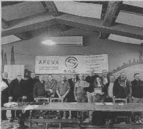
Soddisfazione. I membri di Apema Siena.

L'assemblea ha visto la partecipazione di altri rappresentanti regionali, che hanno condiviso le iniziative e i progressi compiuti per consolidare