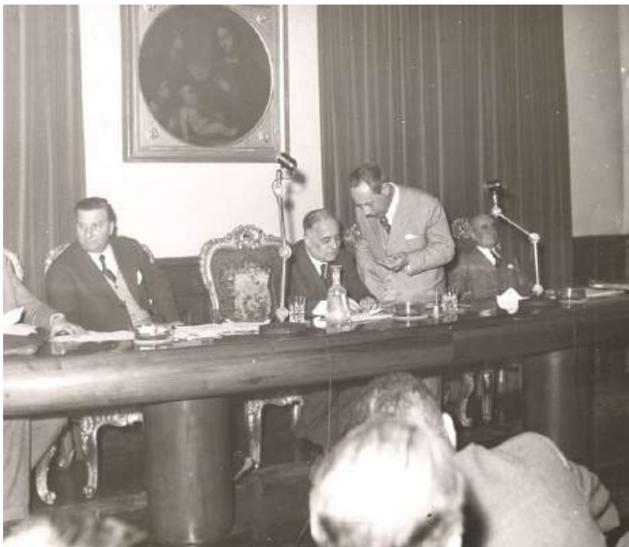
X congresso nazionale Trebbiatori e Motoaratori

Nello stesso anno, in occasione dell'assemblea nazionale tenutasi a Cremona il 21 aprile, anche la denominazione di "Unione Nazionale Trebbiatori e Motoaratori" venne modificata in "Unione Nazionale Imprenditori Meccanizzazione Agricola" (U.N.I.M.A.).