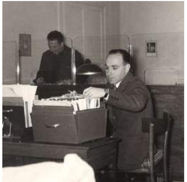
Sala d'attesa nuova sede