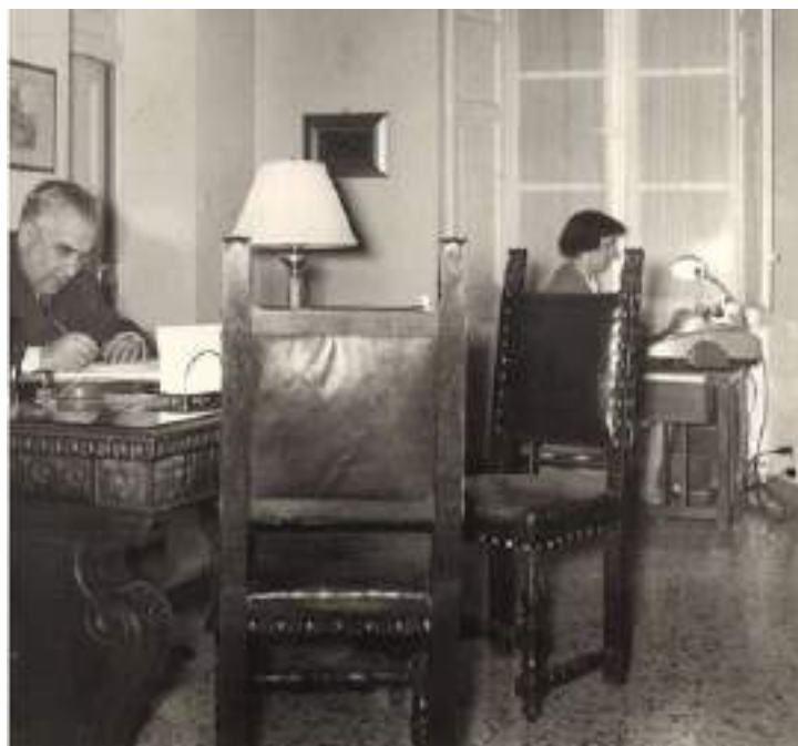
Presidenza nuova sede