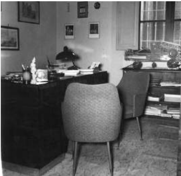
Direzione sede precedente