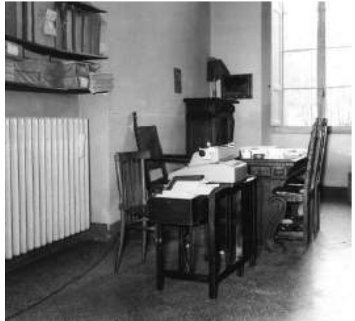
Presidenza sede precedente