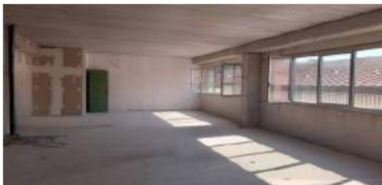
Gli uffici prima dei lavori

Il 22 Novembre 2021 vengono trasferiti gli Uffici in Via L. Cialfi, 29 per garantire spazi più ampi, accoglienti e rispondenti ai nuovi obiettivi.