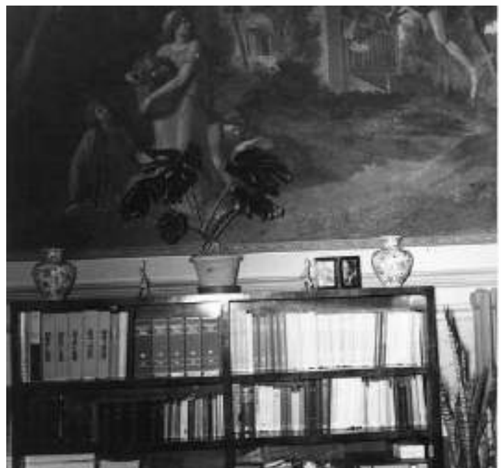
Direzione nuova sede