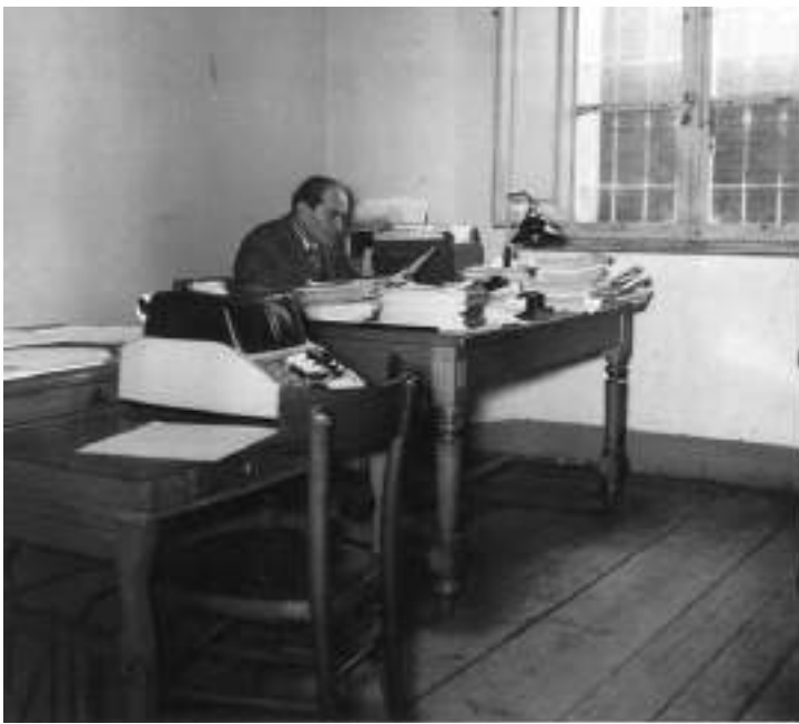
Ufficio amministrazione sede precedente